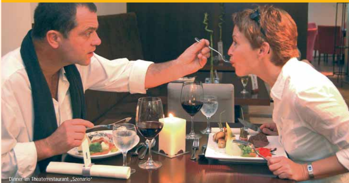
Dinner im Theaterrestaurant „Szenario“