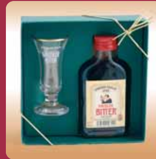
Häußler Bitter Geschenkpackung