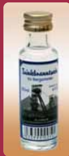
Trinkbranntwein für Bergarbeiter