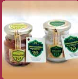
Höhlereft & Hölersülze